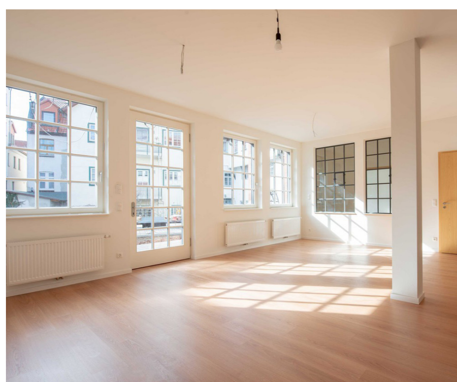
Wohnung A1/ EG - neuer Zustand; Sascha Bühner