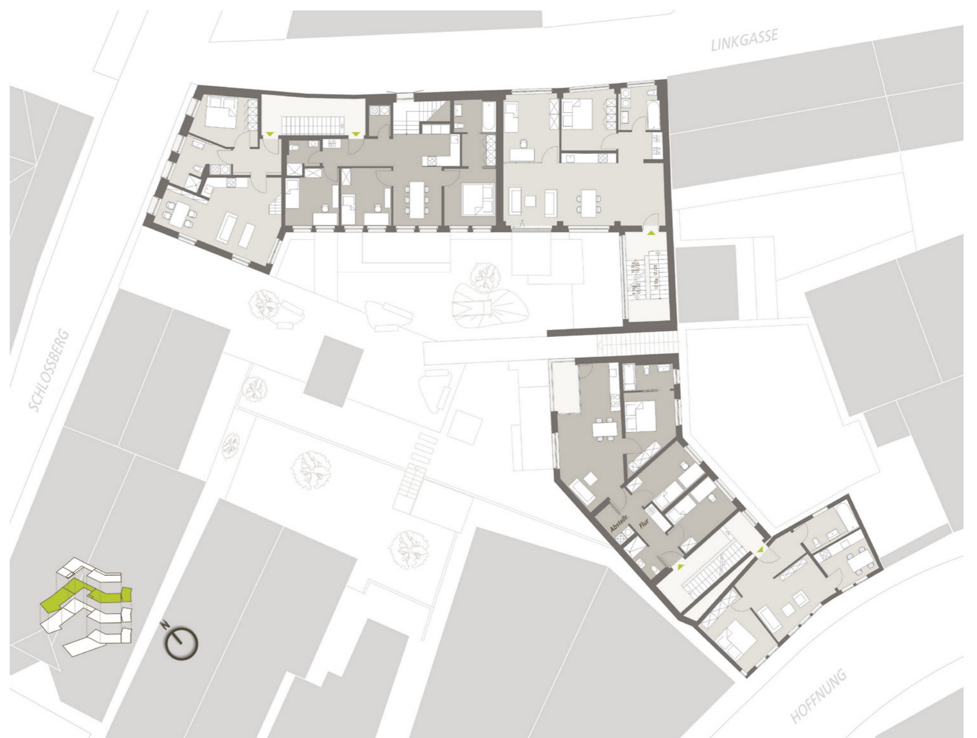
Übersicht 1. Obergeschoss; Bießmann+Büttner