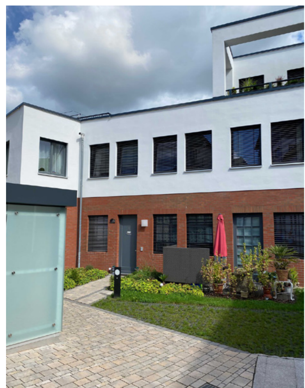
Ansicht Innenhof - nach der Gestaltung der Außenanlagen; Bießmann+Büttner