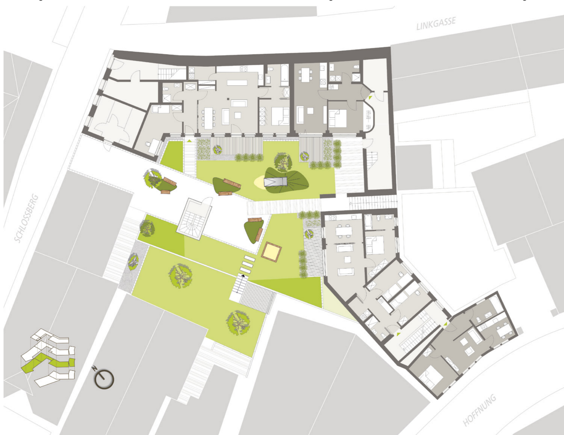
Übersicht Erdgeschoss; Bießmann+Büttner