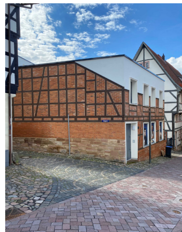
Straßenansicht Schlossberg; Bießmann+Büttner