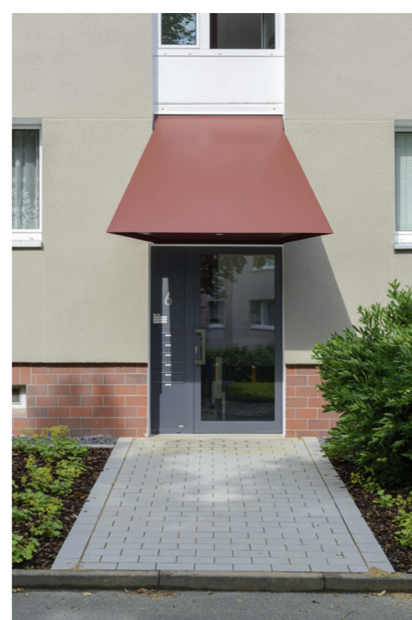
Fassadendetails; Claus Bach