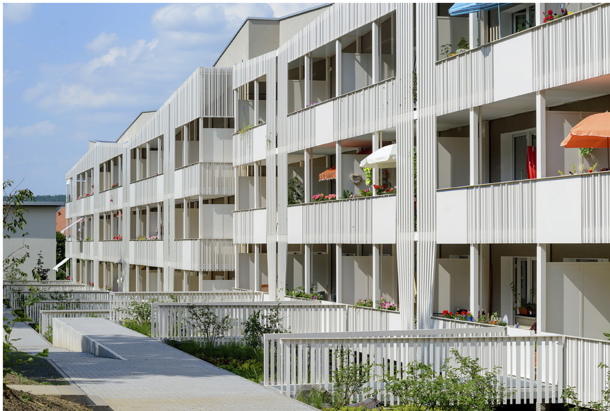
Balkonstruktur Fassade West (Ausschnitt); Claus Bach