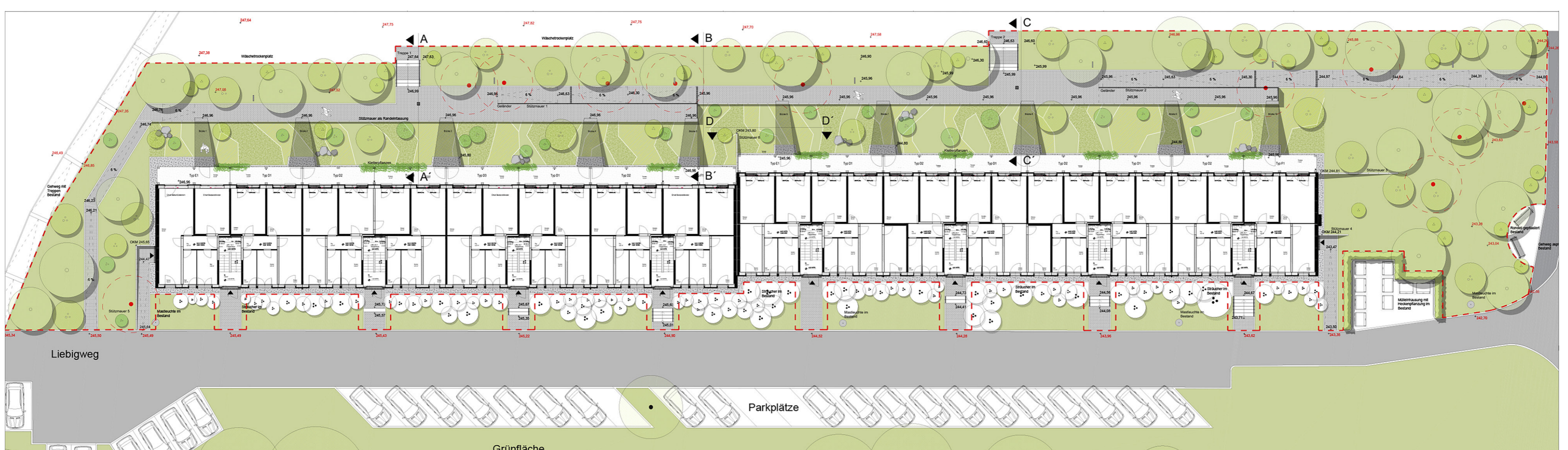
Grundriss Erdgeschoss mit Freianlagen; plandrei Landschaftsarchitektur GmbH