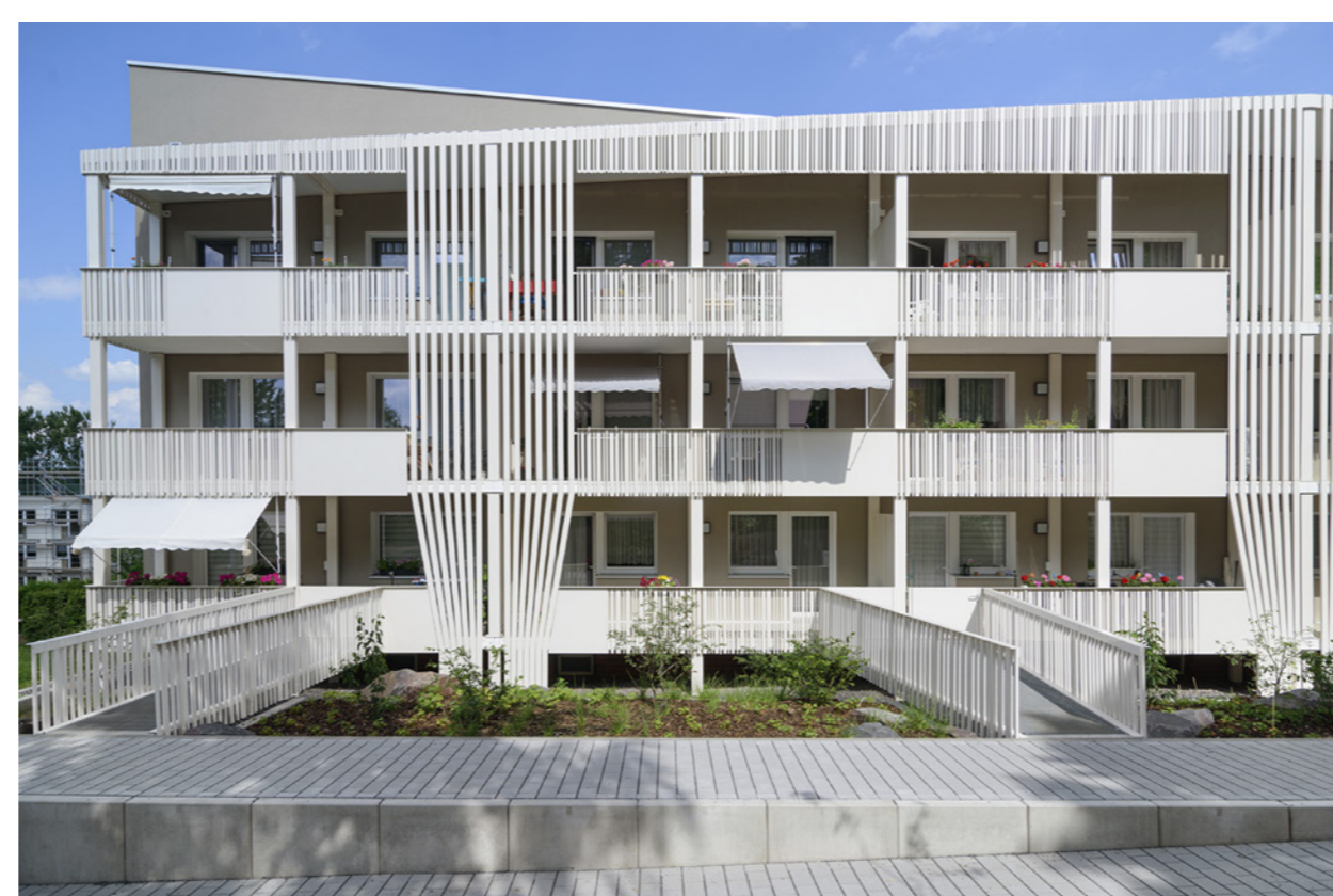
Ausschnitt Fassade West; Claus Bach