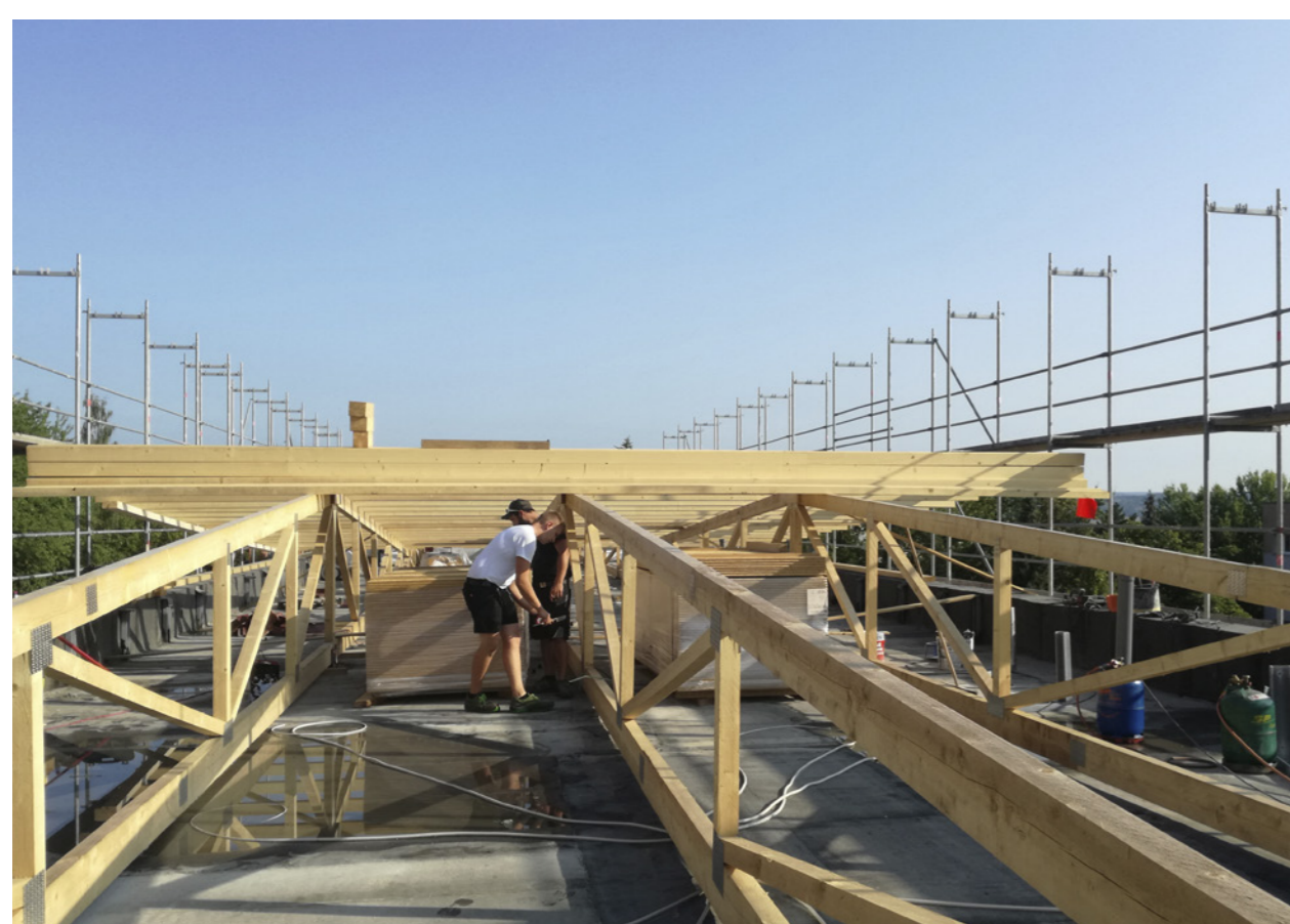
Dachkonstruktion im Bau; Schettler & Partner