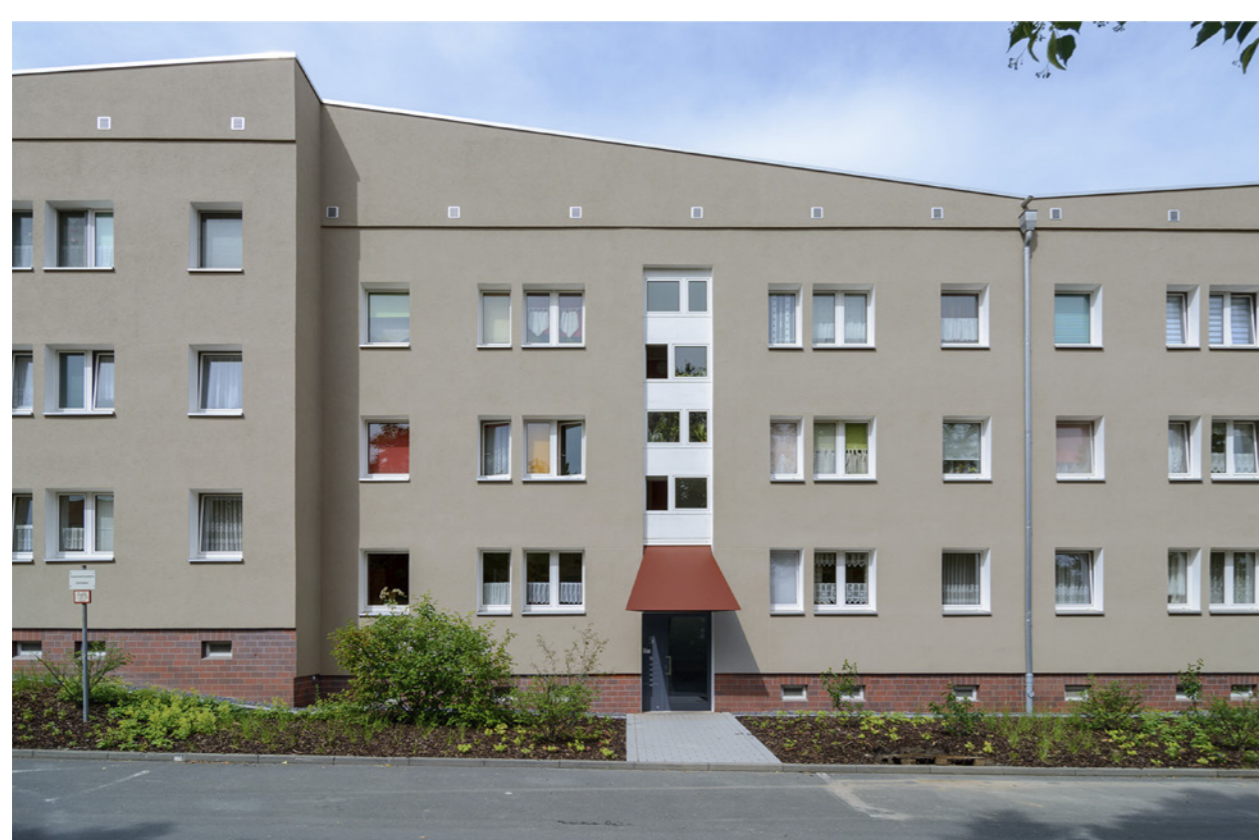
Ausschnitt Fassade Ost; Claus Bach