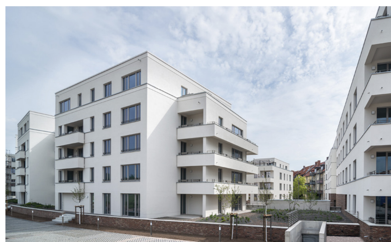
Bogenhäuser und Torhaus 1 mit Durchblick auf den Anger; Claus Bach