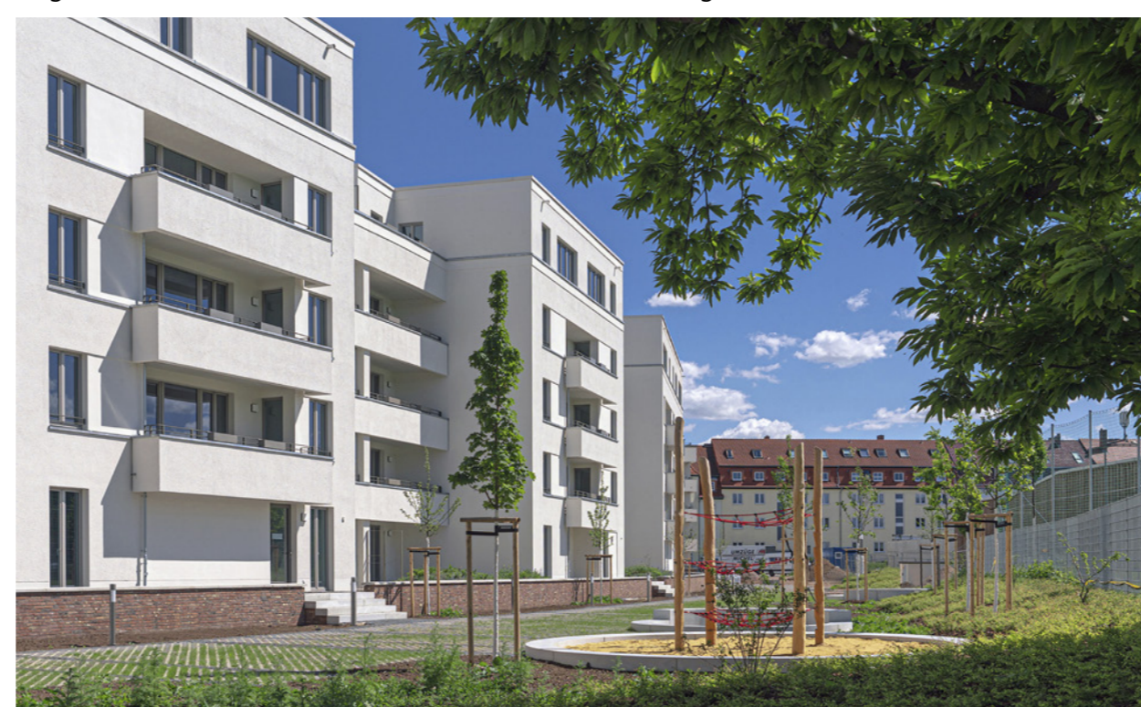
Bogenhäuser Westseite mit dem Wiesengarten; Ronald Neumeister