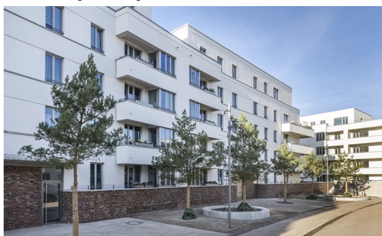
Bogenhäuser Ostseite Ausschnitt; Claus Bach