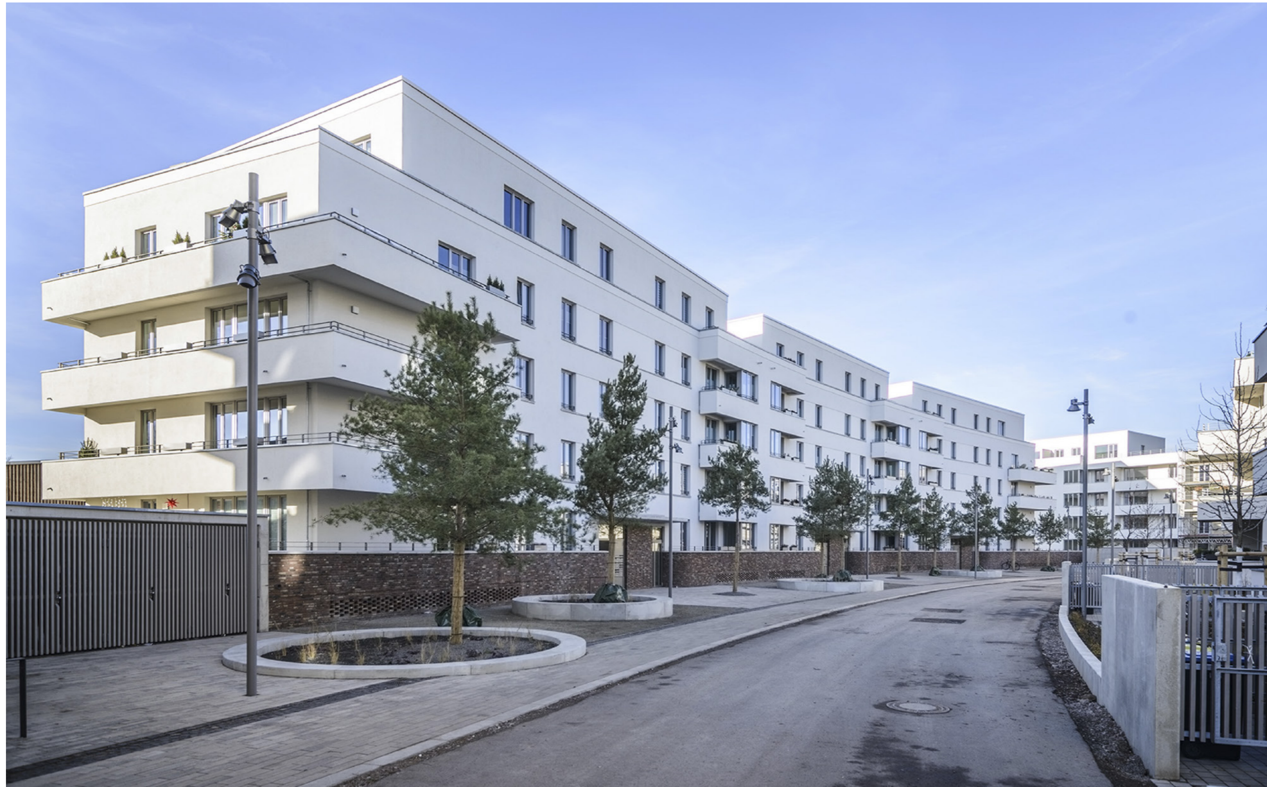
Blick über den Anger auf die Bogenhäuser; Claus Bach

plandrei Landschaftsarchitektur GmbH, Erfurt