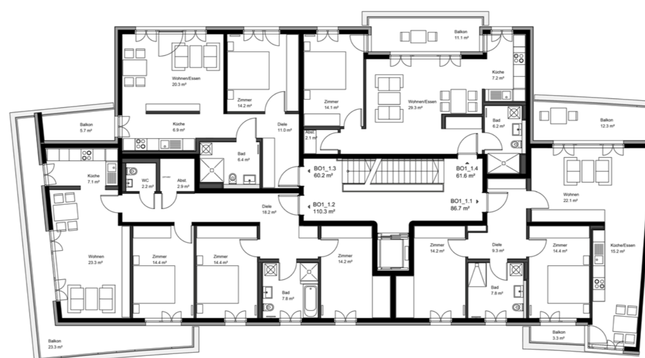
Grundrisse Bogenhaus 1.OG; Schettler & Partner