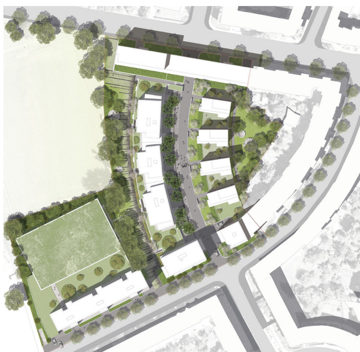
Freianlagenplan; plandrei Landschaftsarchitektur