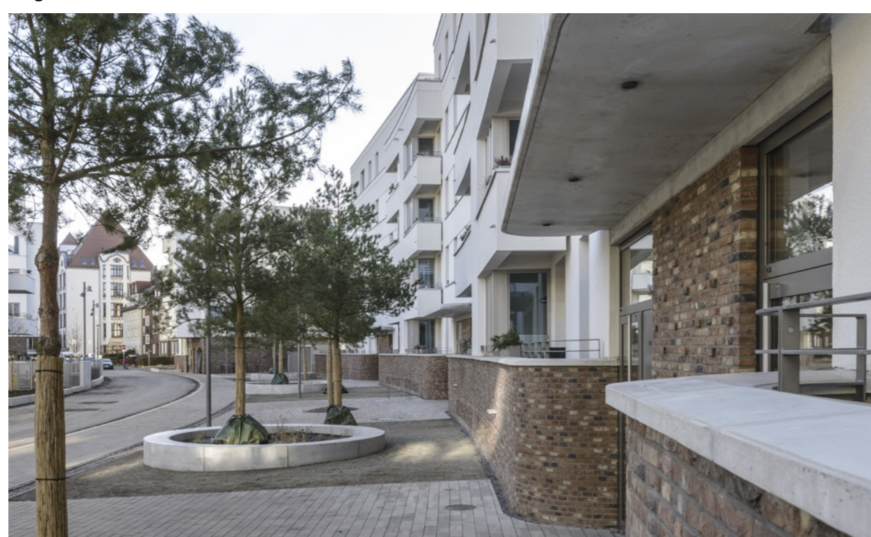
Bogenhäuser Ostseite Klinkersockel; Claus Bach