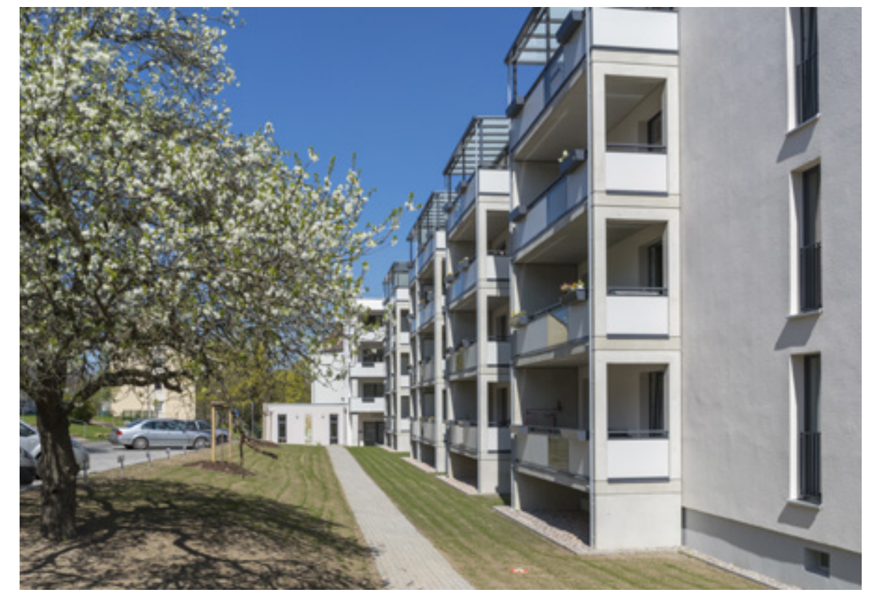
großzügige Balkone Südseite ehemaliger Altbau | Foto: Alexander Burzik