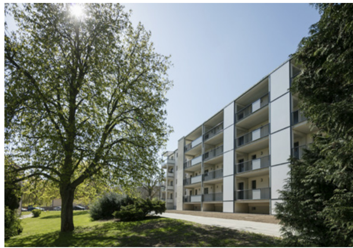
Laubengang im grünen Quartier | Foto: Alexander Burzik