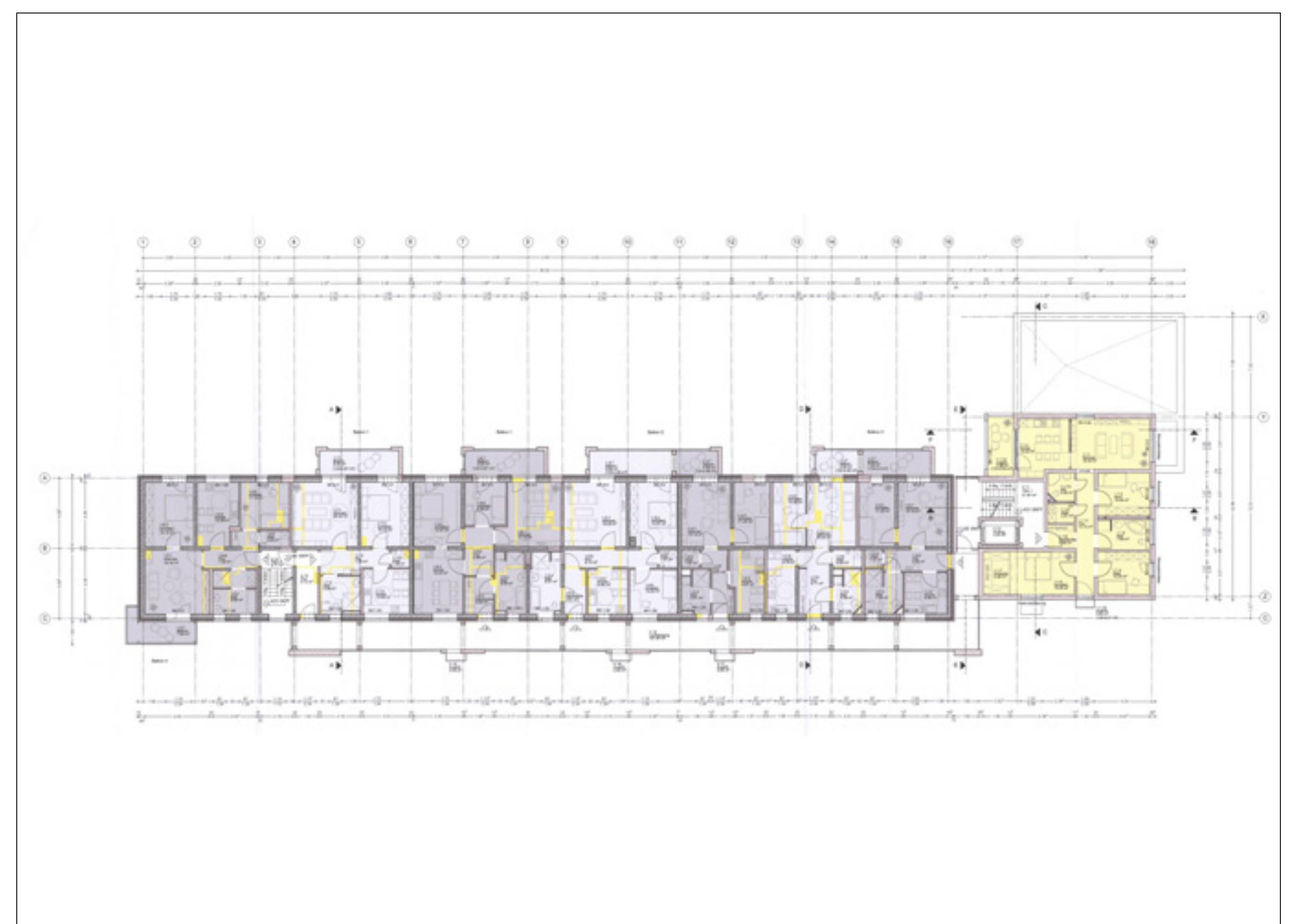
Regelgrundriss Wohngeschosse | Plan: Projektscheune