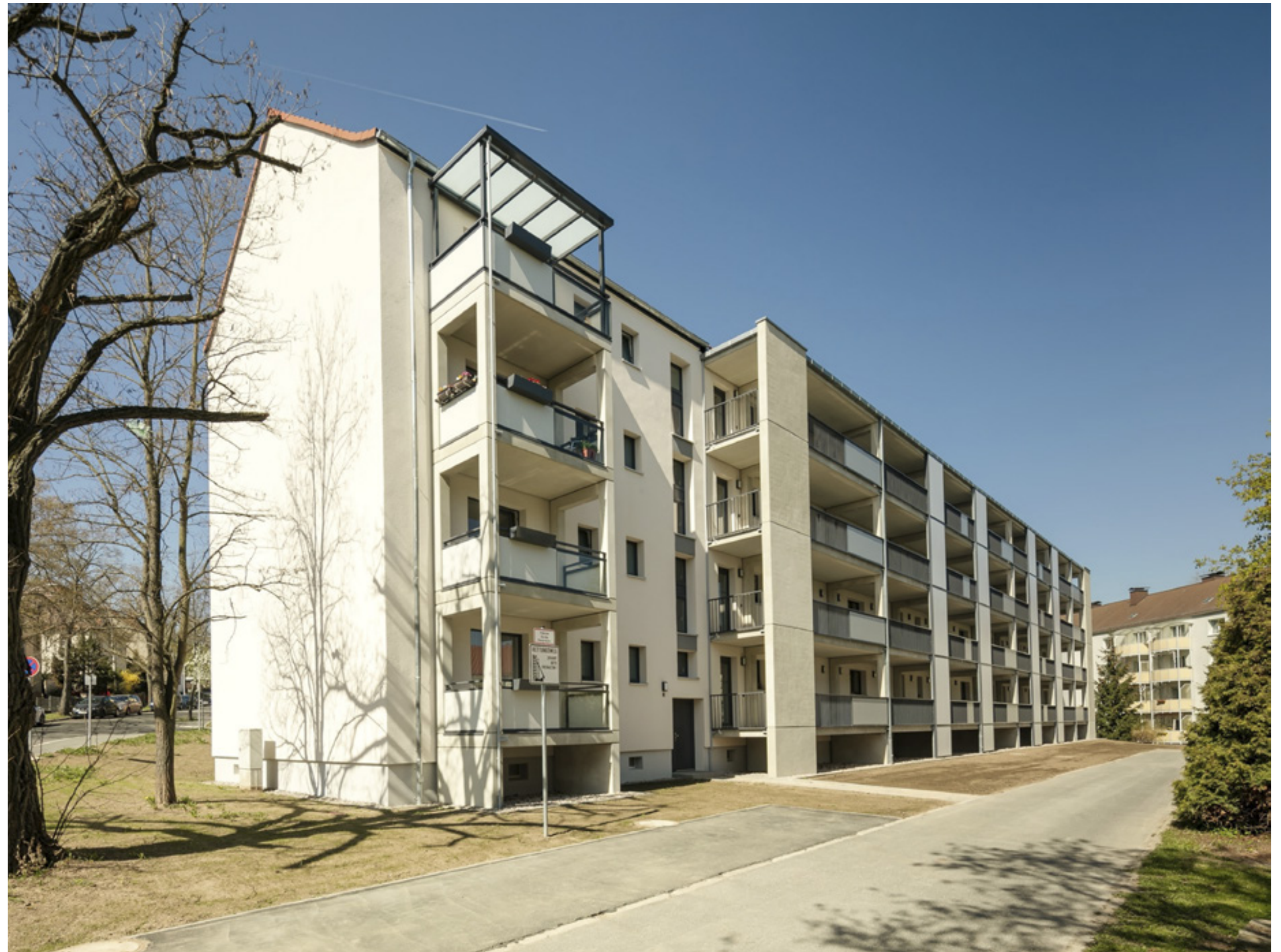
Laubengangseite ehemaliger Altbau

Helk Architekten und Ingenieure GmbH, Mellingen