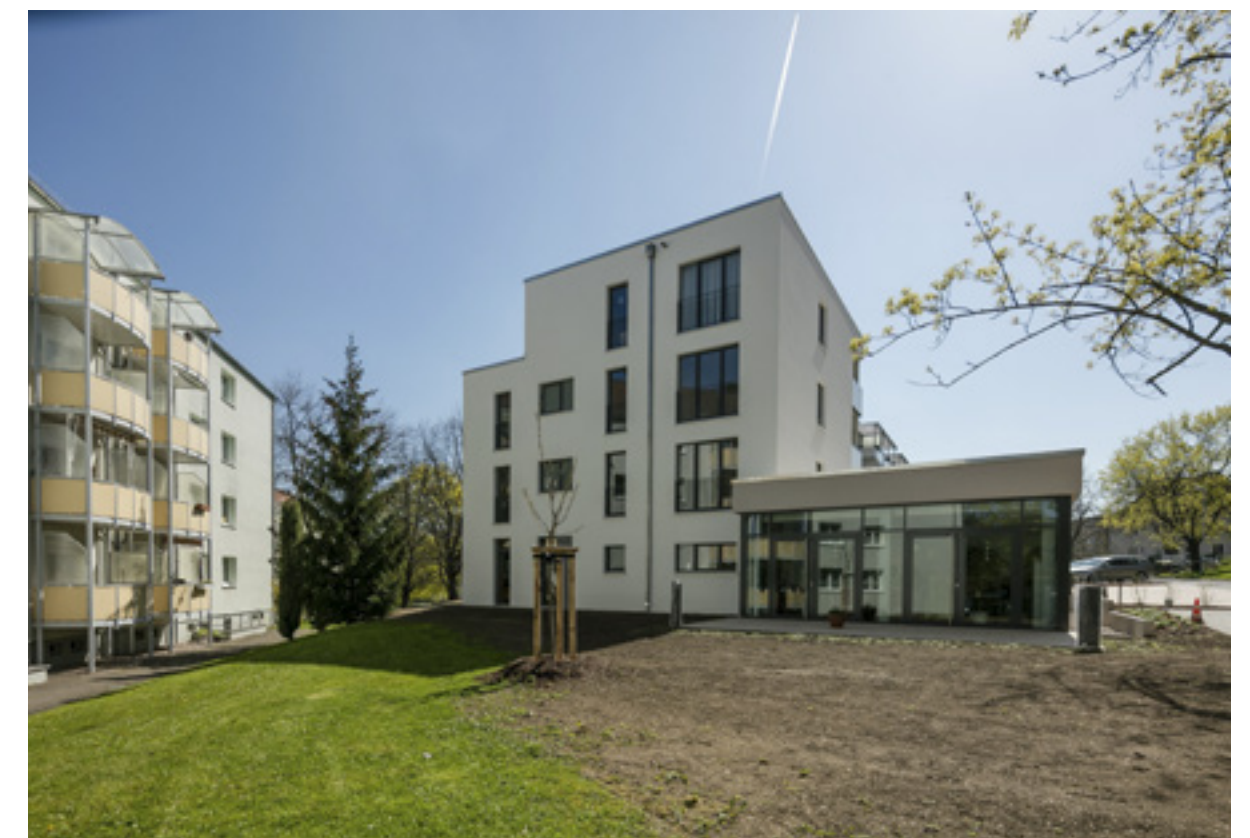
Neubau mit Tagespflege