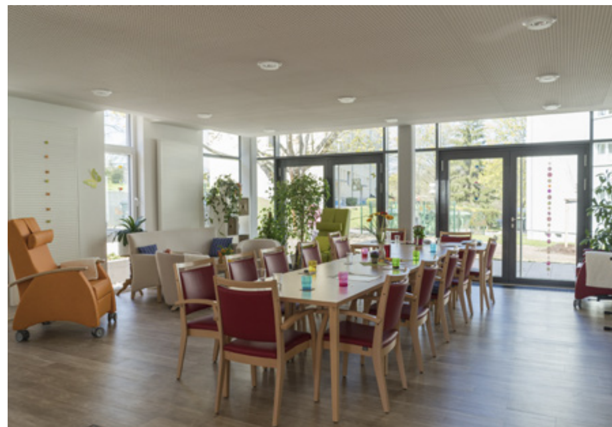
Mehrzweckraum Tagespflege