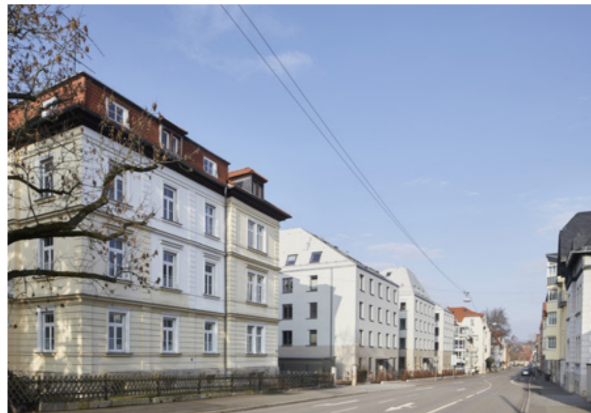
Ensemble Breitscheidstraße | Foto: Oli Hege