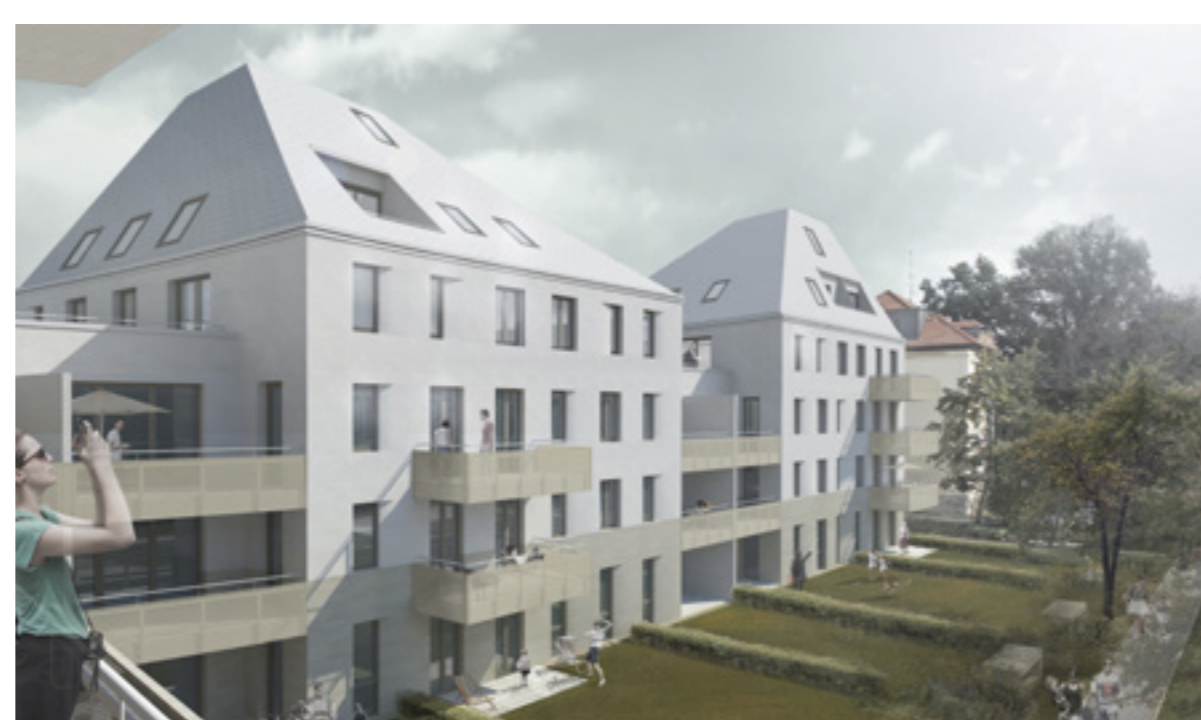
Visualisierung Innenhof | Plan: motorplan