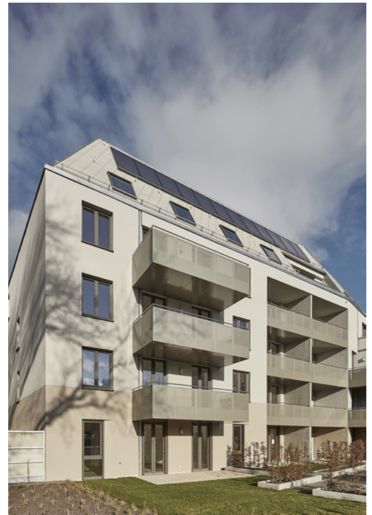
Balkone und Loggien