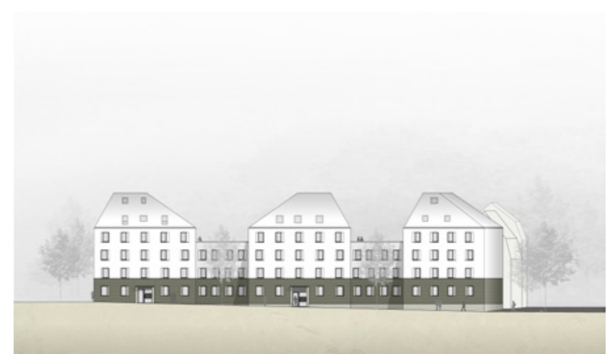
Ansicht Breitscheidstraße | Plan: motorplan