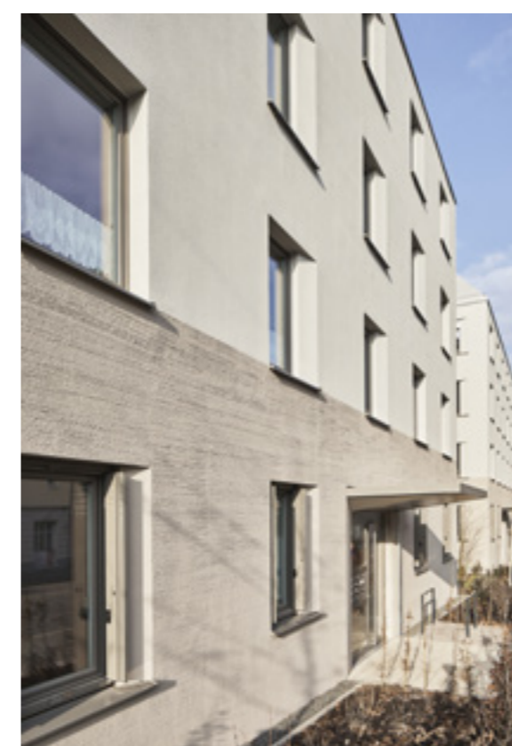
Fassadendetail | Foto: Oli Hege