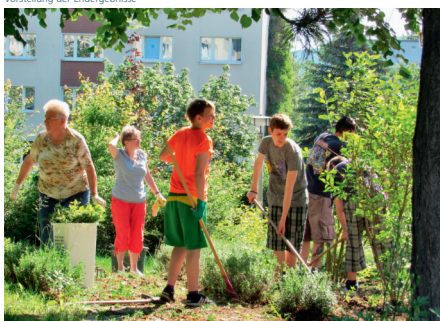
Die Anwohner sind fleißig beim Arbeitseinsatz