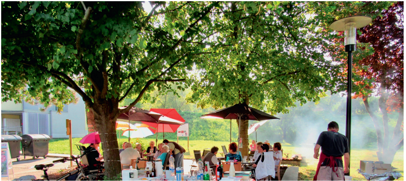
Das Sommercafé als beliebter Treffpunkt im Wohngebiet