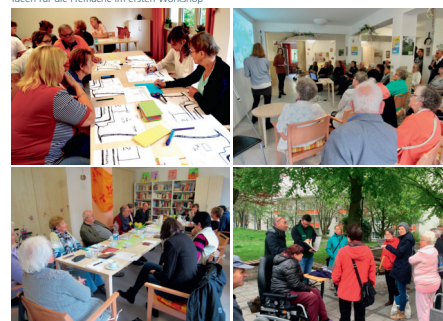
oben: Es entstehen die ersten Entwürfe unten: Regelmäßige Projektberatung