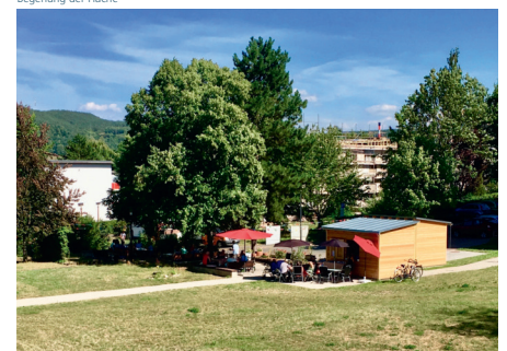
Die Pavillons stehen und werden rege genutzt