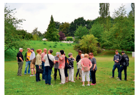
Begehung der Fläche