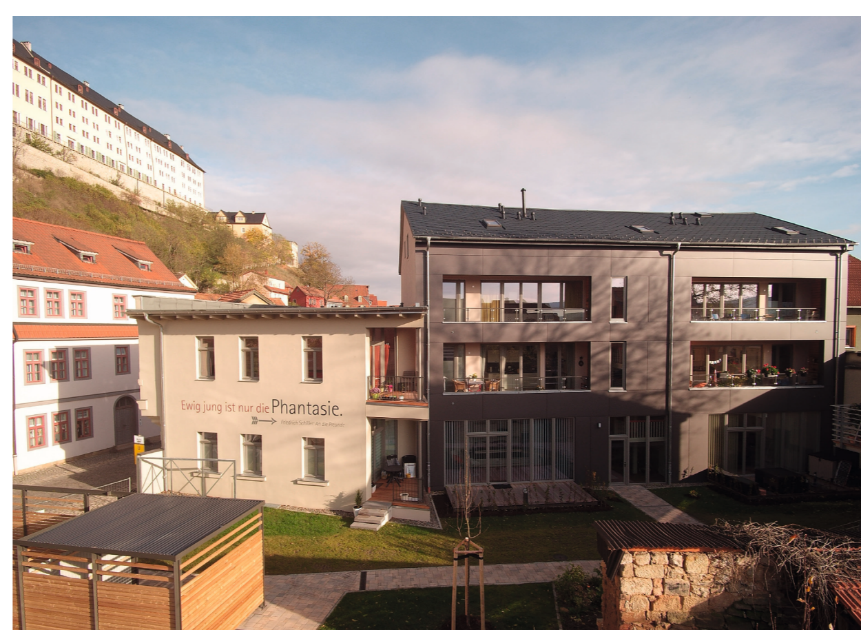
Fassade Hof

Die Jury würdigt mit einer Anerkennung den gelungenen Beitrag des Wohnungsunternehmens zur Stadtreparatur mit den Mitteln des zeitgemäßen Wohnungsbaus bei Wahrung der Belange des Denkmalschutzes.