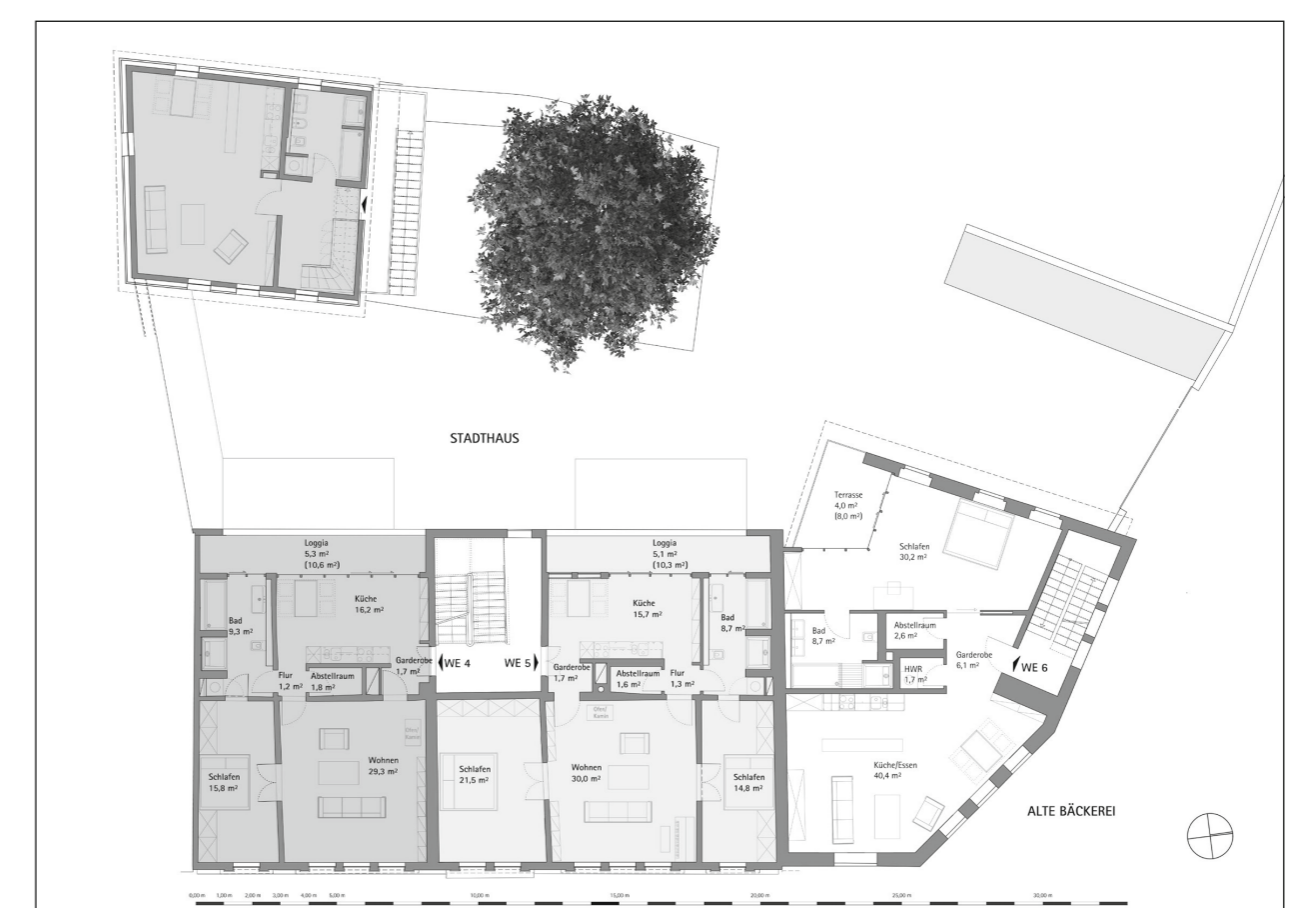
Grundriss 1. Obergeschoss | Pläne: HKS Erfurt