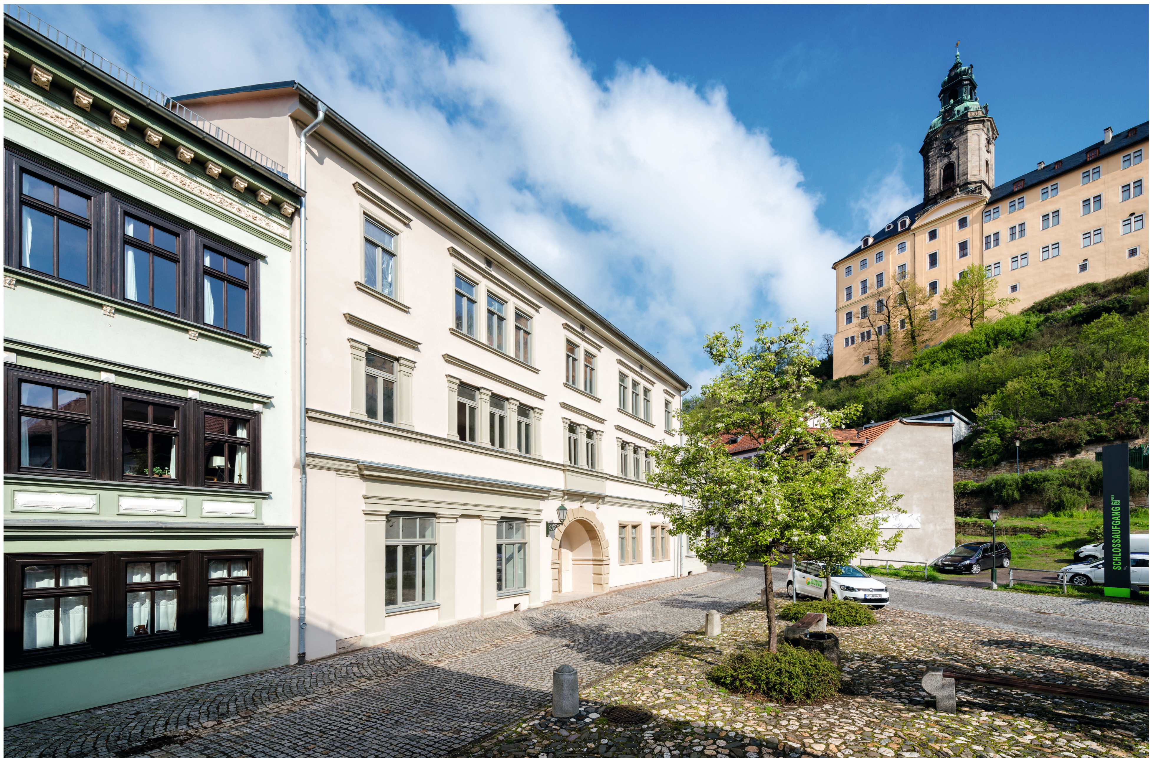
Fassade Platz