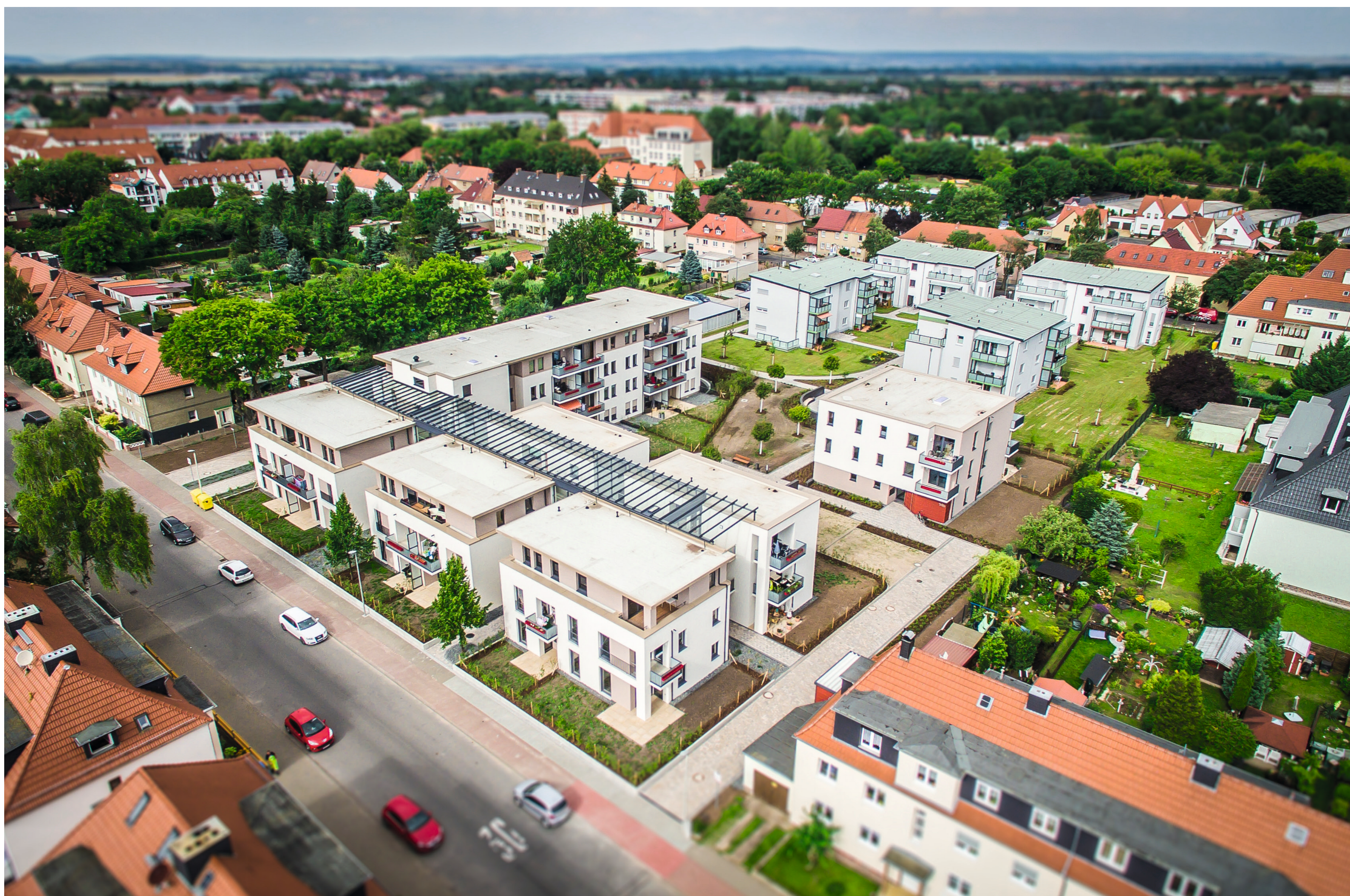
Ansicht Rannstedter Straße – Blick auf Sömmerda