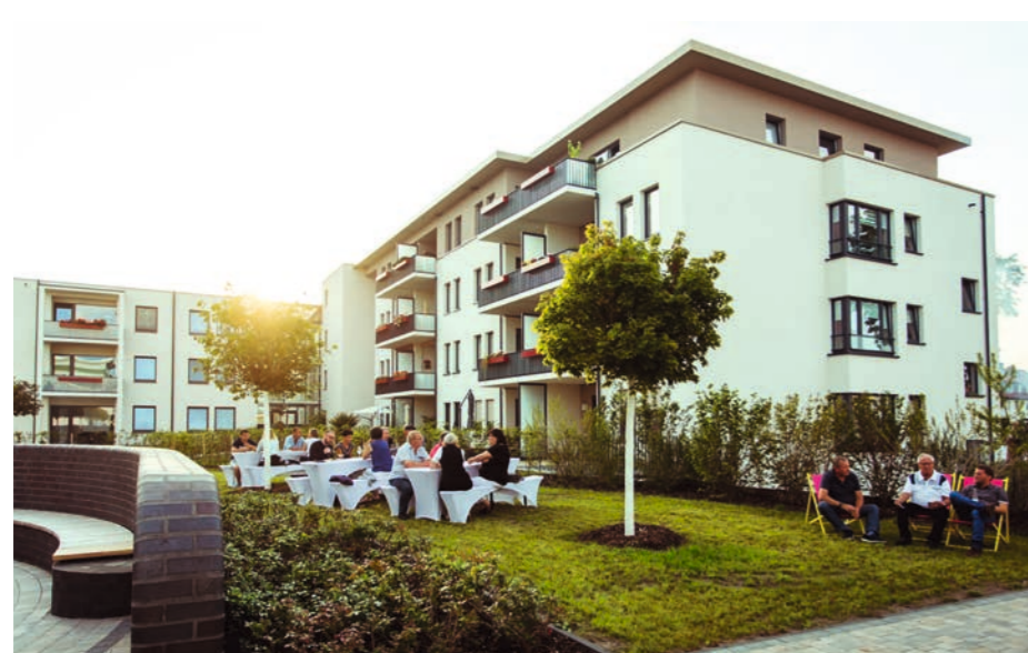
Eröffnungsfeier am 24.08.2017

Einstimmig würdigt die Jury das baukulturelle Engagement der Genossenschaft mit dem Thüringer Preis der Wohnungswirtschaft.