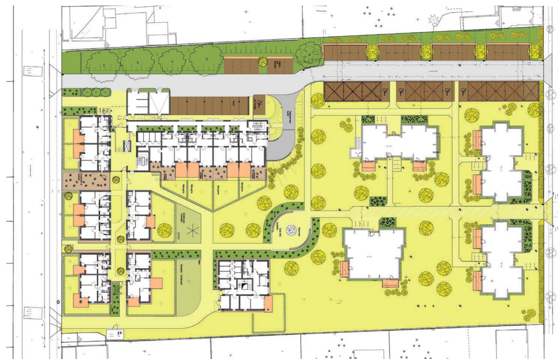
Lageplan Gesamtanlage | Plan: WENDT Architekt & Ingenieur GmbH