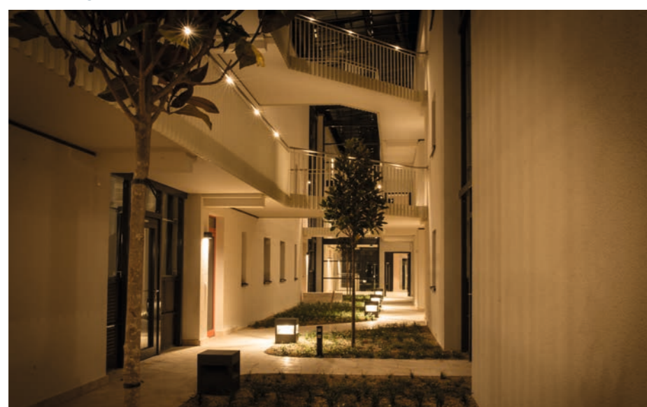
Lichtkonzept im Atrium